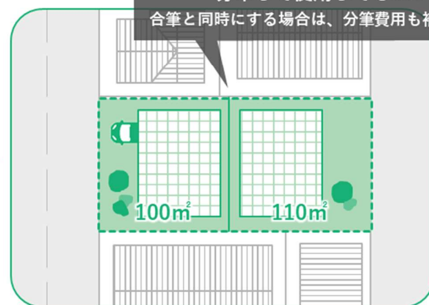
戸建住宅に建て替えて 2 筆に分けて売却